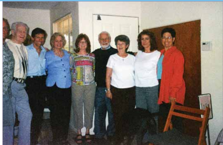
Photo de groupe d'Arizona

La base de cette maîtrise réside dans un esprit équilibré, logé dans un corps aux habitudes