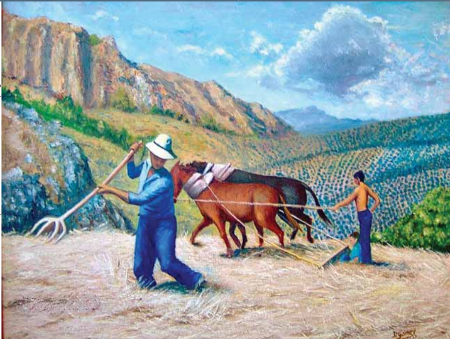
"La saison de la moisson" Peinture par Demetrio Gomez (Madrid, Espagne)